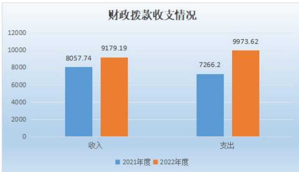
图 4：2021-2022 年度财政拨款收支情况（单位：万元）