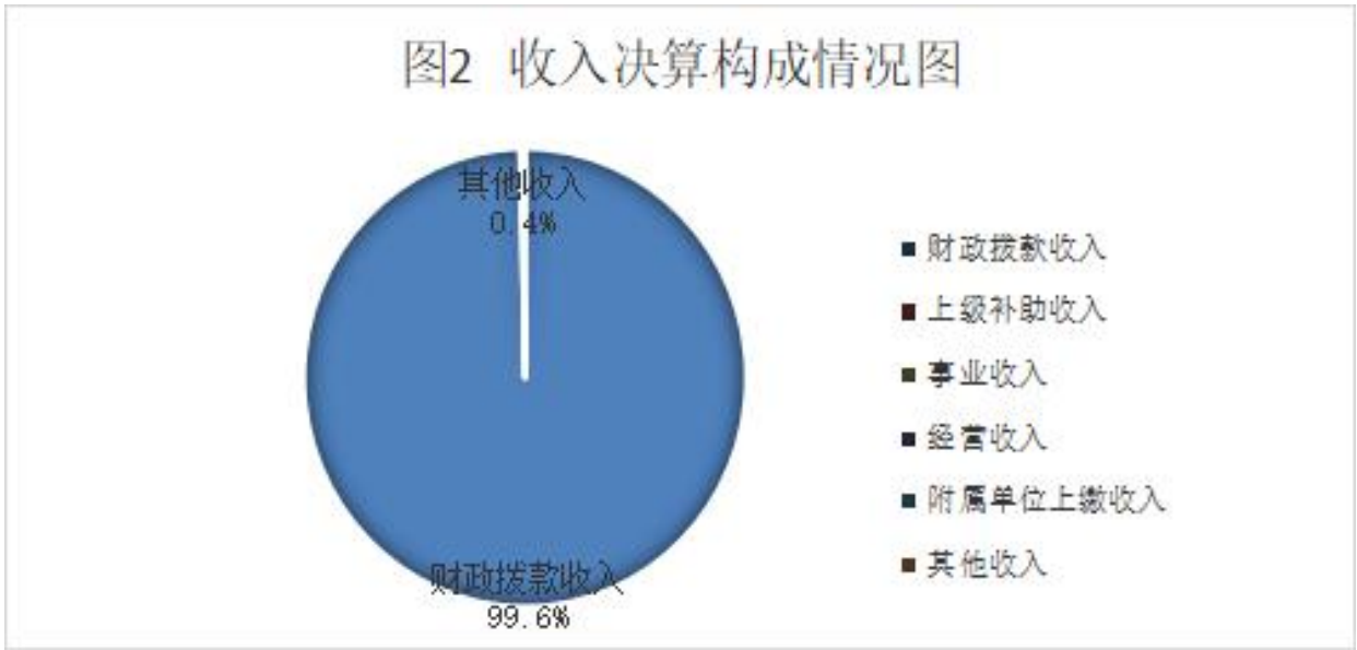
图 2：收入决算构成情况（单位：万元）