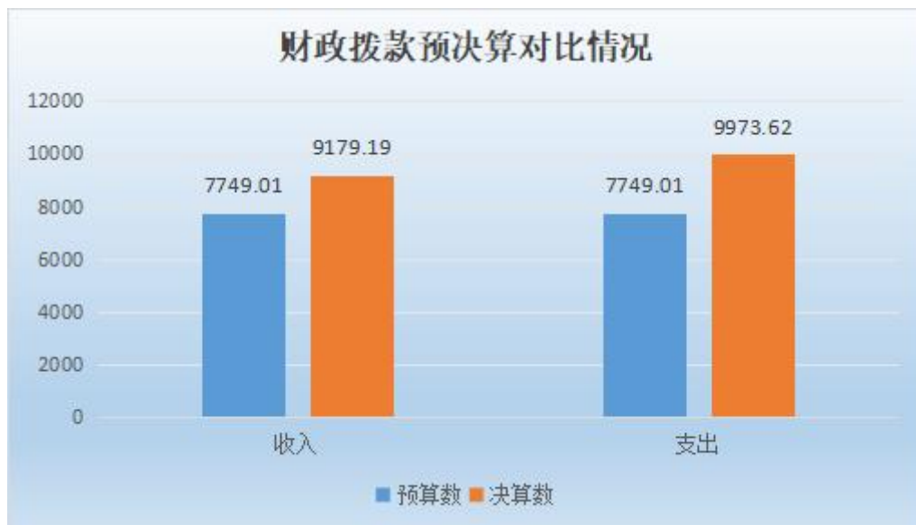
图 5：2022 年度财政拨款预决算对比情况（单位：万元）