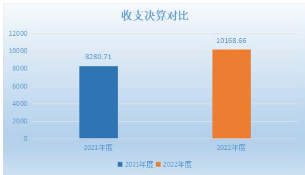
图 1:2021-2022 年度收支总计对比情况 (单位: 万元)